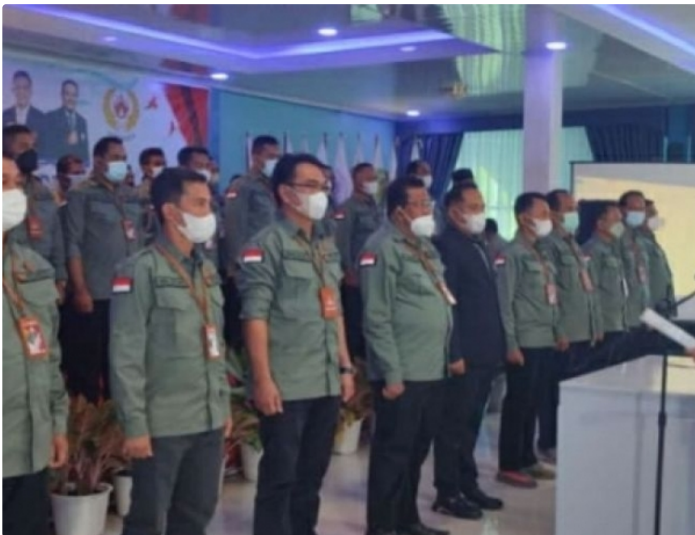
Pelantikan dan pengukuhan 63 orang pengurus Komite Olahraga Nasional Indonesia (KONI) masa bakti 2021-2025.